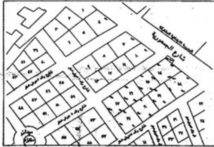
الموقع قبل ضم القطيع (١٨ و ١٩) بمقياس رسم ١ / ٥٠